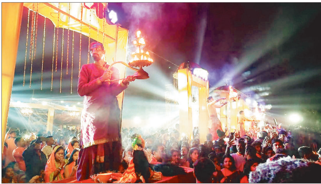
हसदेव नदी सर्वमंगला तट पर नमामि हसदेव समिति द्वारा की गई महाआरती।