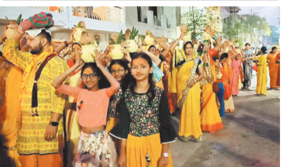
शिवाजीनगर में निकाली गई कलशयात्रा।