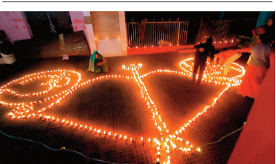
हसदेव नदी तट पर बनाया गया धनुष।