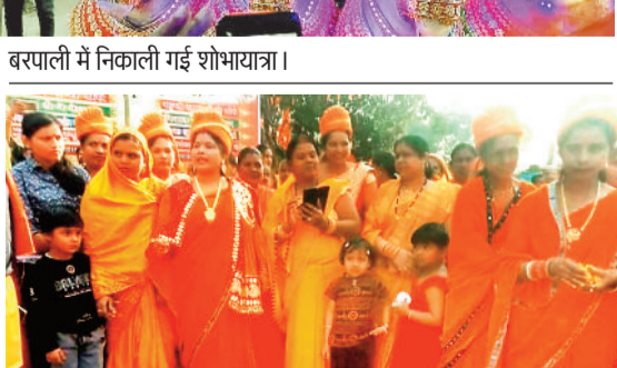
रजगामार में महिलाओं ने निकाली रैली।