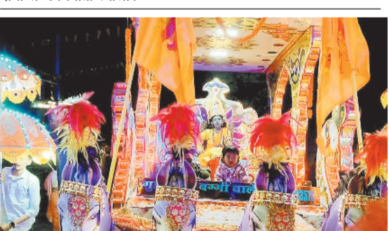
बरपाली में निकाली गई शोभायात्रा।