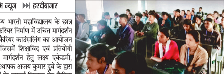
काउंसलिंग में उपस्थित छात्र।