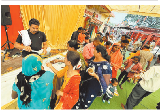
सर्वमंगला मंदिर में भंडारे में प्रसाद लेते दर्शनार्थी।