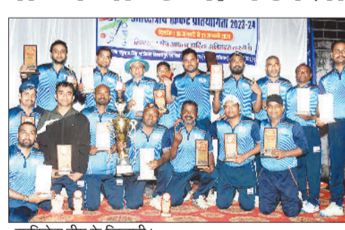
उपविजेता टीम के खिलाड़ी।