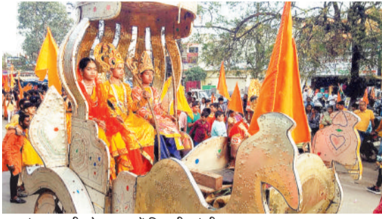
बजरंग दल की शोभायात्रा में निकली झांकी।