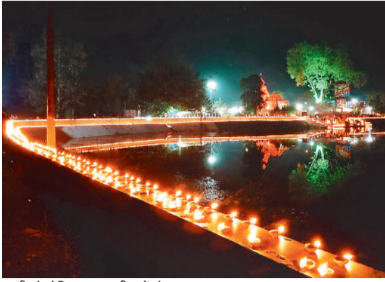
पाली नौकोनिया तालाब दीपको से सजा हुआ।