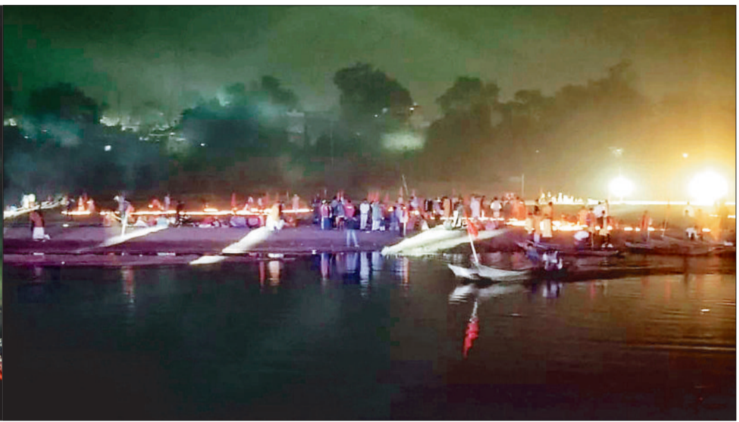
देर शाम हसदेव नदी में किया गया दीप दान।