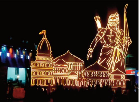
घंटाघर में राम मंदिर का लगाया गया कटआउट।