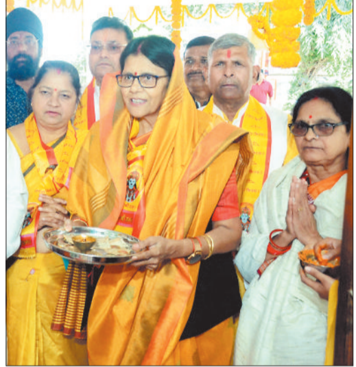
पूजा करने पहुंची सांसद ज्योत्सना महंत।