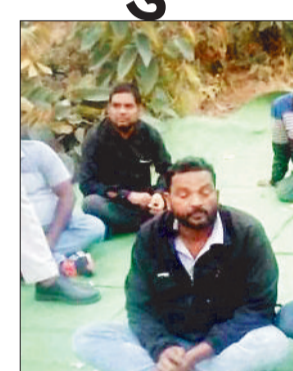
पिकनिक स्पॉट पर फड़ जमाने वाले जुआरी।