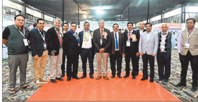
सम्मेलन में जुटे अस्थि रोग विशेषज्ञ।